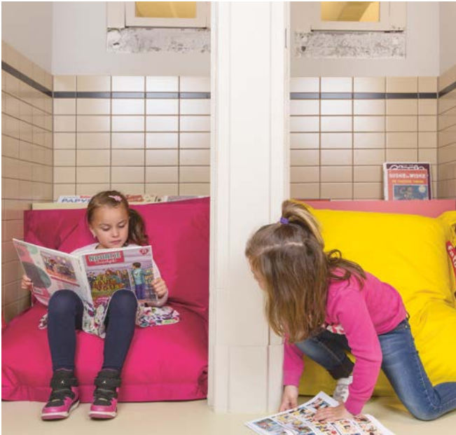
Impressionen aus School 7: Die Bibliothek soll die gesamte Gemeinde gleichermaßen ansprechen.