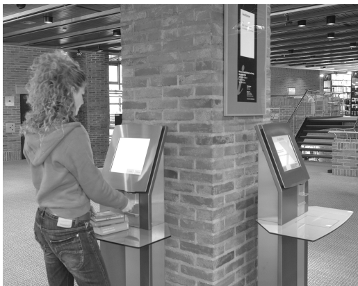
Die Ausleihterminals in der Zentralbibliothek

Bitte schließen Sie Ihr Konto unverzüglich nach der letzten Ausleihe. Betätigen Sie dazu eine der Schaltflächen Quittung oder Beenden .