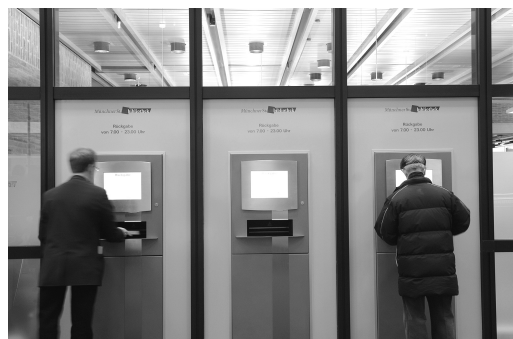
Die Rückgabeterminals vor der Zentralbibliothek

Die Rücknahmeterminals nehmen Medien einzel n auf und befördern sie über ein Band in die Sortieranlage. Sobald das Terminal das Medium registriert hat, ist die Rückgabe vollzogen und es wird von Ihrem Ausweis abgebucht.