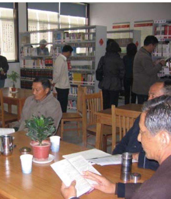
„Leseteestube“ in Guli

Den im dörflichen Umfeld angesiedelten Bibliotheken in Menglan, Guli und Jiangxiang gemein-