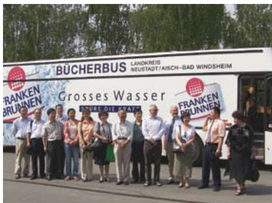
Chinesische Gäste vor dem Bücherbus in Neustadt/Aisch